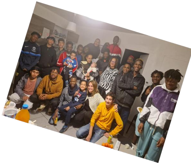
Séjour à la mer à Palavas.