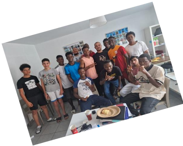
Moments de partage à Champagne